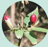
ツルリンドウの実