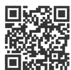
日本農業機械工業会HP