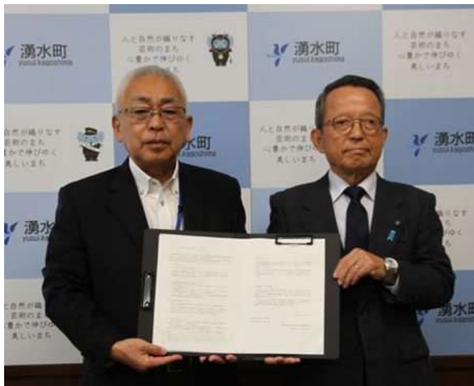
審議委員会委員長から 町長へ答申書を提出