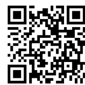
「手編みの物語をみつめる」プロジェクト QRコード