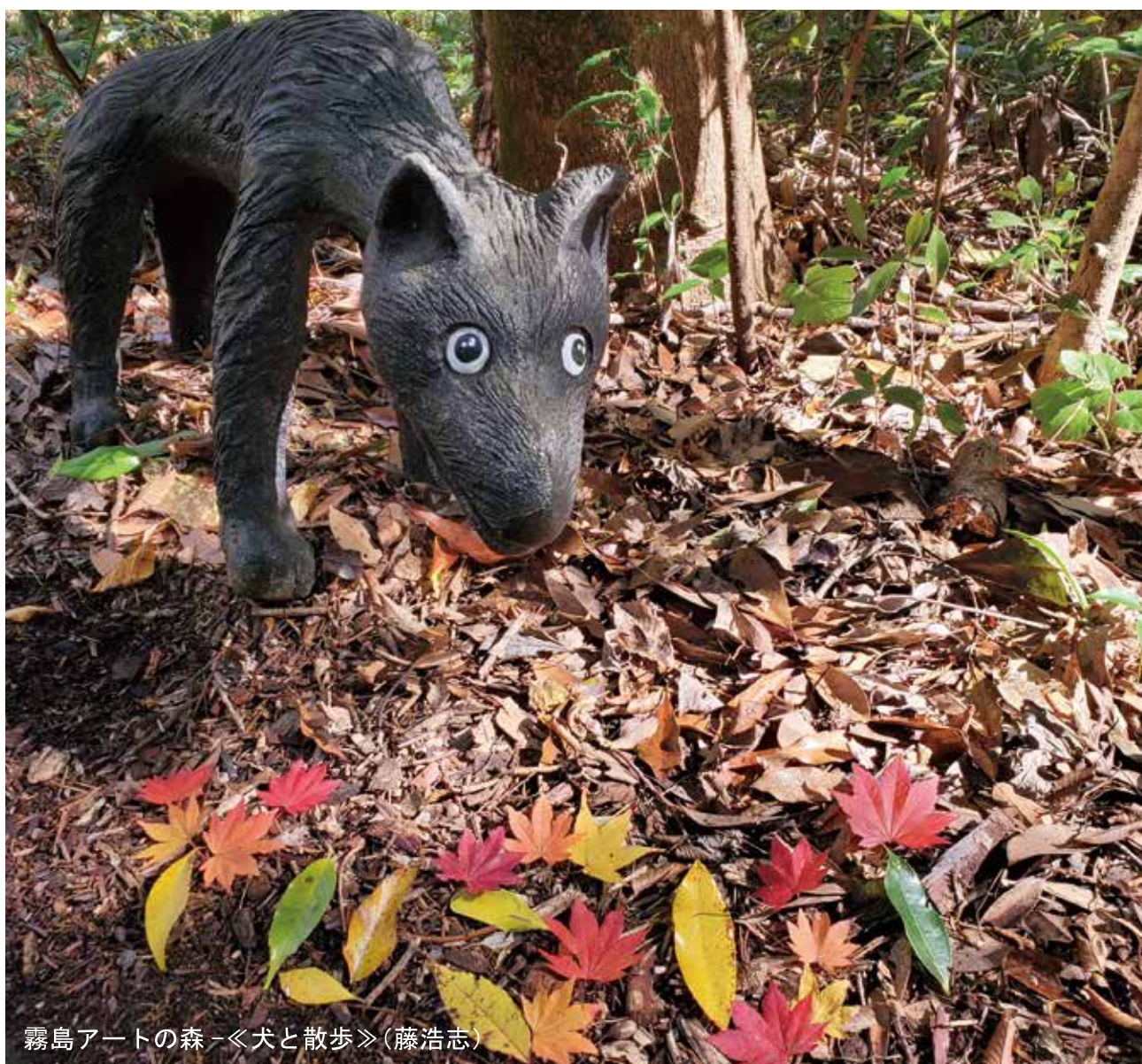
霧島アートの森-《犬と散歩》(藤浩志)