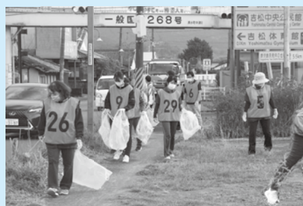
林内科医院とつつはの園の皆さん