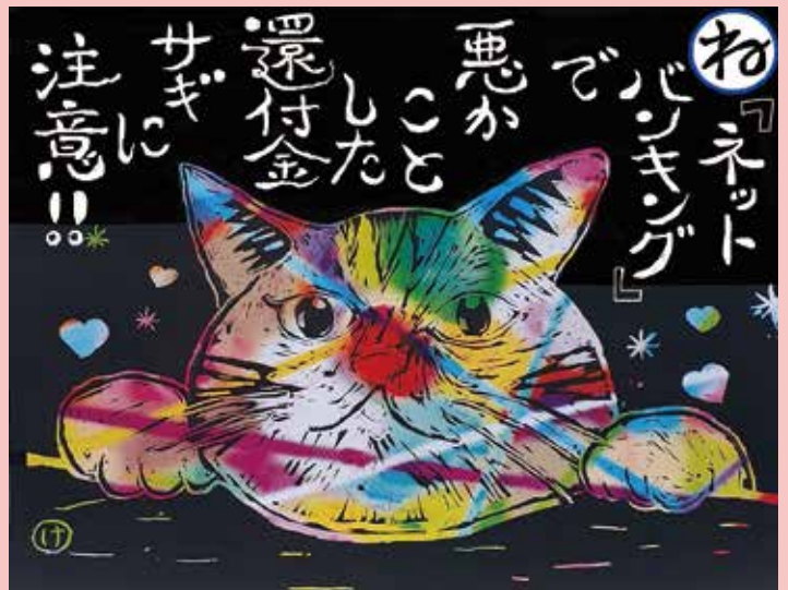
イラスト 恒岡謙二様 提供

行政職員を名乗る男性から「健康保険料の払い戻しが3万円ある」と電話があった。その後、払い戻し先の口座がある金融機関を名乗った電話があり、暗証番号を聞かれ、教えたくないが「キャッシュカードや通帳がそちらにあるので大丈夫」といわれ、伝えてしまった。不安になりその金融機関に確認すると、勝手にインターネットバンキングの申し込みがされていた。還付金詐欺はこれまでATMで振り込ませる手口が主でしたが、本人に成りすましてインターネットバンキングの利用を申し込み、預金を他の口座に不正に送金する手口です。公的機関や金融機関等が、口座番号や暗証番号などを聞き出すことはありません。絶対に教えないようにしましょう。