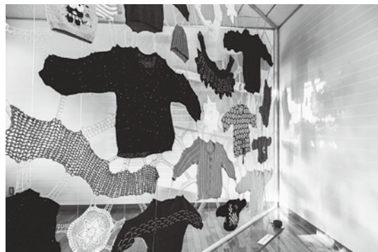
「いとなみ」(湧水町くりの図書館／鹿児島) 2021年

自分ではない誰かの日常から生まれたそれぞれの情景に思いを馳せることで、境遇の違いを越えた普遍的な物語を体感するものとなるでしょう。