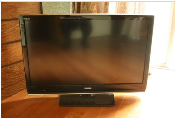
使用可能備品 (テレビ)