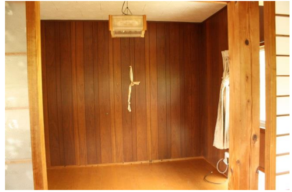
2階洋室④ (4. 5畳)