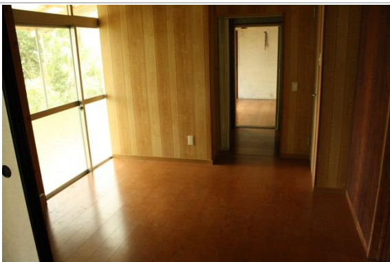
洋室① (4. 5畳)