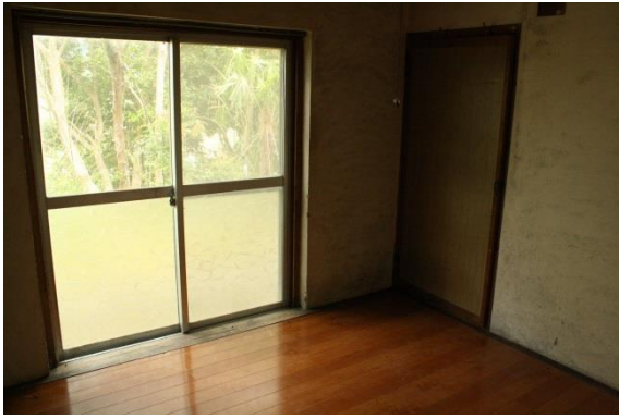
洋室③ (4. 5畳)