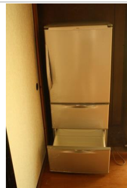
使用可能備品 (冷蔵庫)