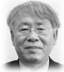
篠原 三千人 議員