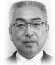
池上 滝一 議員