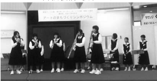
いきいきセンター町民ホール アートのまちづくりシンポジウム