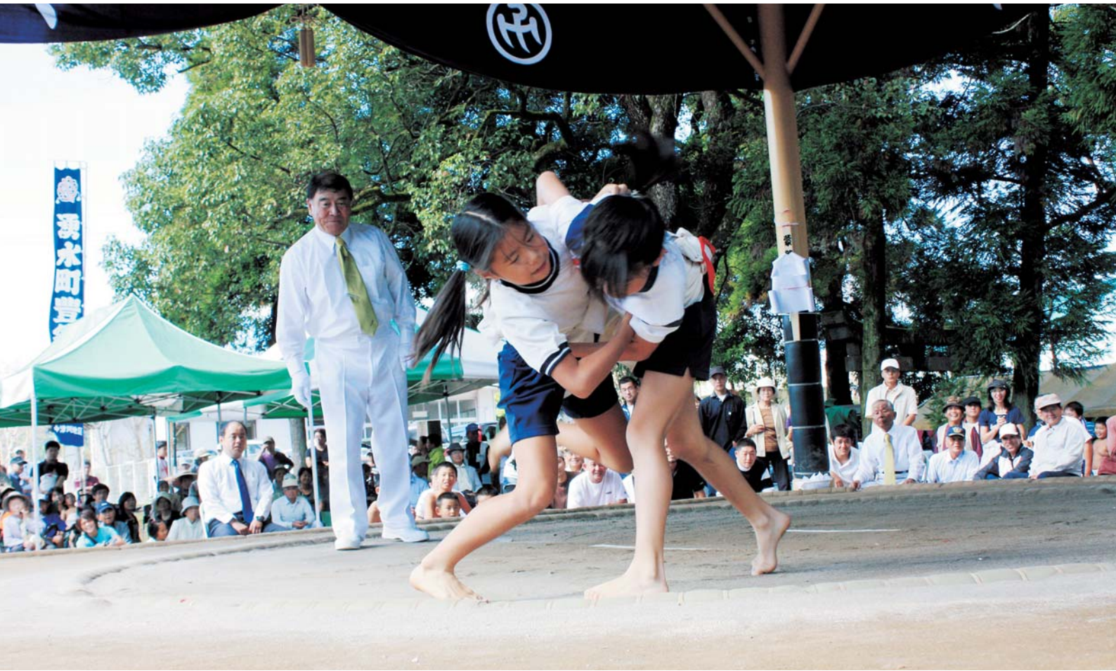
湧水町豊祭相撲大会