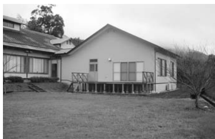
森のやかた湯ったり館 増築工事

内容 ゆったり館増築工事費及び厨房等の改修工事、備品購入費等の事業を行うことにより来館者に対しサービスの向上が図られるものであります。