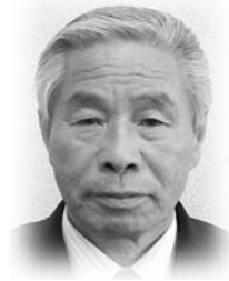
福島 勝男 議員