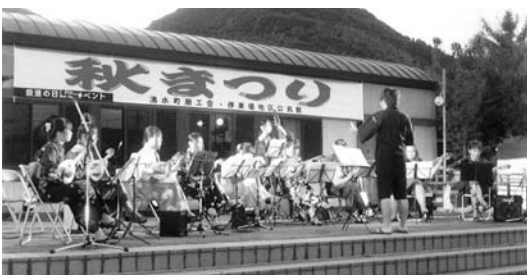
吉松駅前 秋まつり