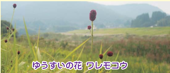
ゆうすいの花 フレモコウ

山野や田の畦など比較的湿気のある所を好む多年草。高さ50~100cm、葉は互生で奇数羽状複葉。秋、茎の上部で枝を分け長さ1~2cmの花序を出す。フレモコウの花が暗紅紫色に咲き初める頃になると、秋もようやく深まってくる。