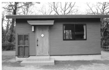
栗野岳ログ・キャンプ村バンガロー新設工事

答弁 ログとしては同規模のものでありますが、発注に於いては外部からの電気設備や浄化槽設置等の工事が異なりますので分割発注であります。