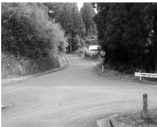
農道川井田線と町道田尾原・油田線交差点