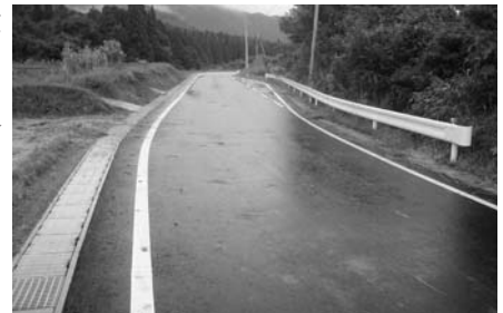
特定防衛施設周辺整備調整交付金事業 町道四ツ枝・永山線改良舗装工事

答弁 本事業の最終路線は全体構想の中で持っている、現在においては四ツ枝線までの事業であります。