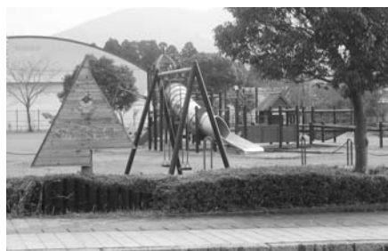
いきいきセンターわんぱく広場

内容 地域活性化・生活対策臨時交付金事業を活用し全額国庫補助により交流施設わんぱく広場の遊具等の新設や既存遊具の修繕及び飾り窓の修繕を行うことで施設利用者が安心安全に利用できるようになったものです。