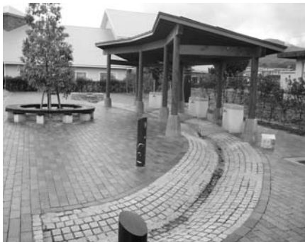
平成20年度まちづくり交付金事業 道路整備工事駅前広場・他

内容 まちづくり交付金道路整備事業の工事概要は名水丸池地内の水飲み場、せせらぎ水路やごんの子レンガ*を使用した舗装工等であります。