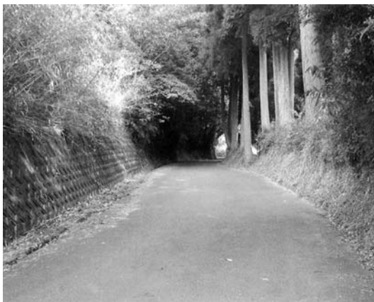
町道田尾原・油田線