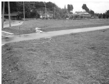
第2上場地区団地造工事

内容 1工区・擁壁工事 3工区・流末処理事業は地域活性化・経済危機対策臨時交付金の活用により、公営住宅建設に向けた準備が整ったものです。団地建設については吉松地区の御手洗団地同様の建屋になります。又、分譲地につきましては区割りも完了済でありました。